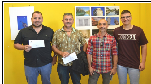
Premiados del rali

Indudablemente, para la gran cantidad de asistencia que recibió, “La Tapa Típica” fue una de las actividades que mejor acogida encontraron, ya que el sábado 7, más de 200 beniarbeginos y visitantes se reunieron en la plaza en torno a la gastronomía local. El evento contó con la presencia de los establecimientos locales; siete bares y la carnicería local, que ofrecieron todo tipo de platos de la cocina tradicional, entre los que se encontraban especialidades como la sangre con cebolla, cocas de mullador, torrat , habas con jamón, figatells, torta de calabaza y chocolate, etc, todas al precio de 1 €. Entre la oferta de bebidas, destacaban los vinos y vermouths artesanos de Bodegas Xaló. La velada se desarrolló en un ambiente festivo y vecinal, amenizada en todo momento con música y juegos infantiles para los más pequeños.