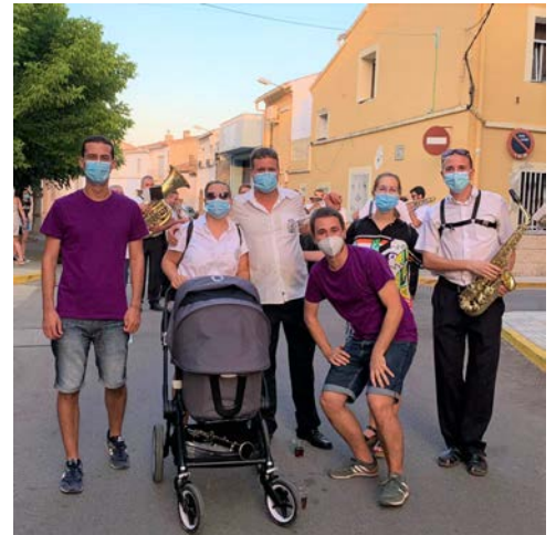
Festeros y banda durante el pasacalles

Por ello, los Festeros y la Unió Musical Beniarbeig acordaron hacer una breve pasacalles por las calles Sant Domènec, Marina Alta y Major, con la que querían poner de manifiesto la importancia de una fiesta que, a pesar de sus pequeños dimensiones, goza de gran seguimiento por parte de beniarbegins y beniarbegines.