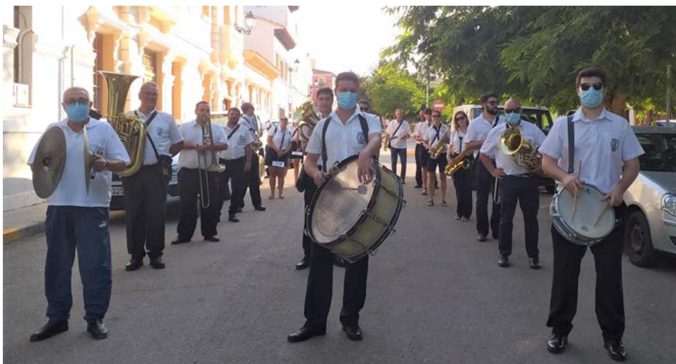
Inicio del pasacalles desde la calle Escoles

por el paseo Jaume I y por la avenida de la Pau, vías por las que no discurre el trazado habitual del pasacalle. Según la Unió Musical Beniarbeig la finalidad era llevar la música a la mayor parte de la ciudadanía, un objetivo que piensan que se alcanzó si se tiene en cuenta la gran cantidad de vecinos de todas las edades que desde puertas, ventanas y balcones aplaudían el paso de los músicos por sus domicilios.